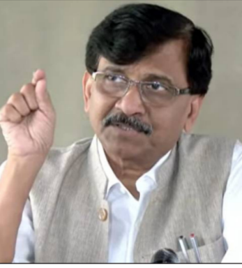
इतिहास आहे, असे राऊत म्हणाले. सुनेत्रापवारयांच्याबद्दल, त्यांच्या कुटुंबाबद्दल, अजितदादांबद्दल आमच्या सद्भावना आहेत. त्या कारणाने